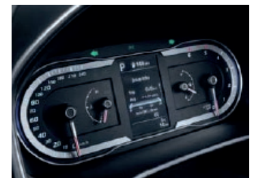
Tablero de 4.2"