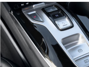
Freno de estacionamiento