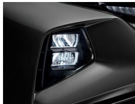
MFR LED lámpara