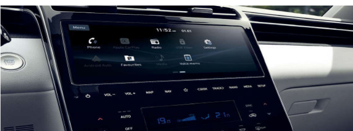
LCD Touch Screen 8" Conectividad Apple Car / Android