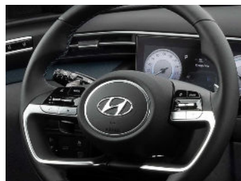
Volante con forro en cuero